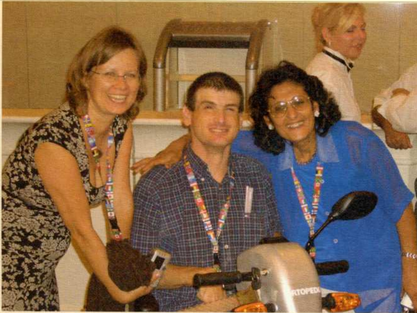
Gäste aus den Vereinigten Arabischen Emiraten, Kanada und Ägypten