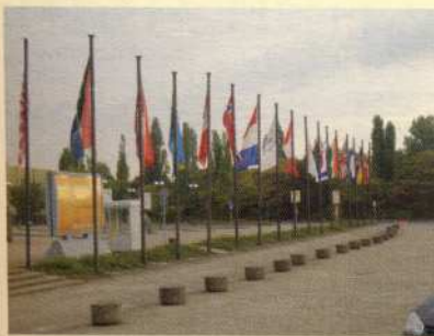
Die Nationalfahnen vor dem Kongresszentrum zur Begrüßung der TeilnehmerInnen