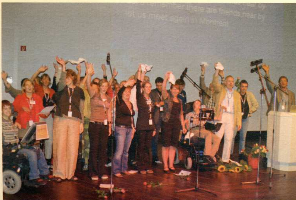
„...let us meet again in Montreal...“ Das Konferenz Team verabschiedet sich auf der Abschlussveranstaltung von den Gästen und richtet den Blick auf die nächste internationale ISAAC Tagung 2008 in Montreal.