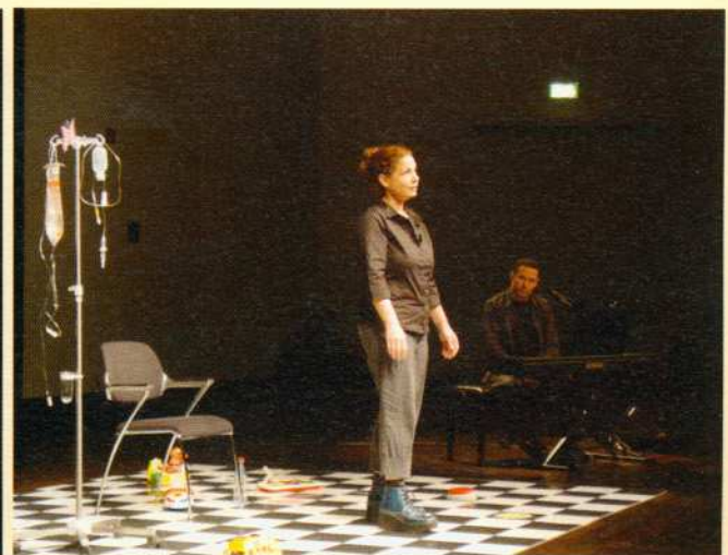
Alon's Smile: Ein beeindruckendes israelisches Theaterstück als Höhepunkt am Mittwoch.